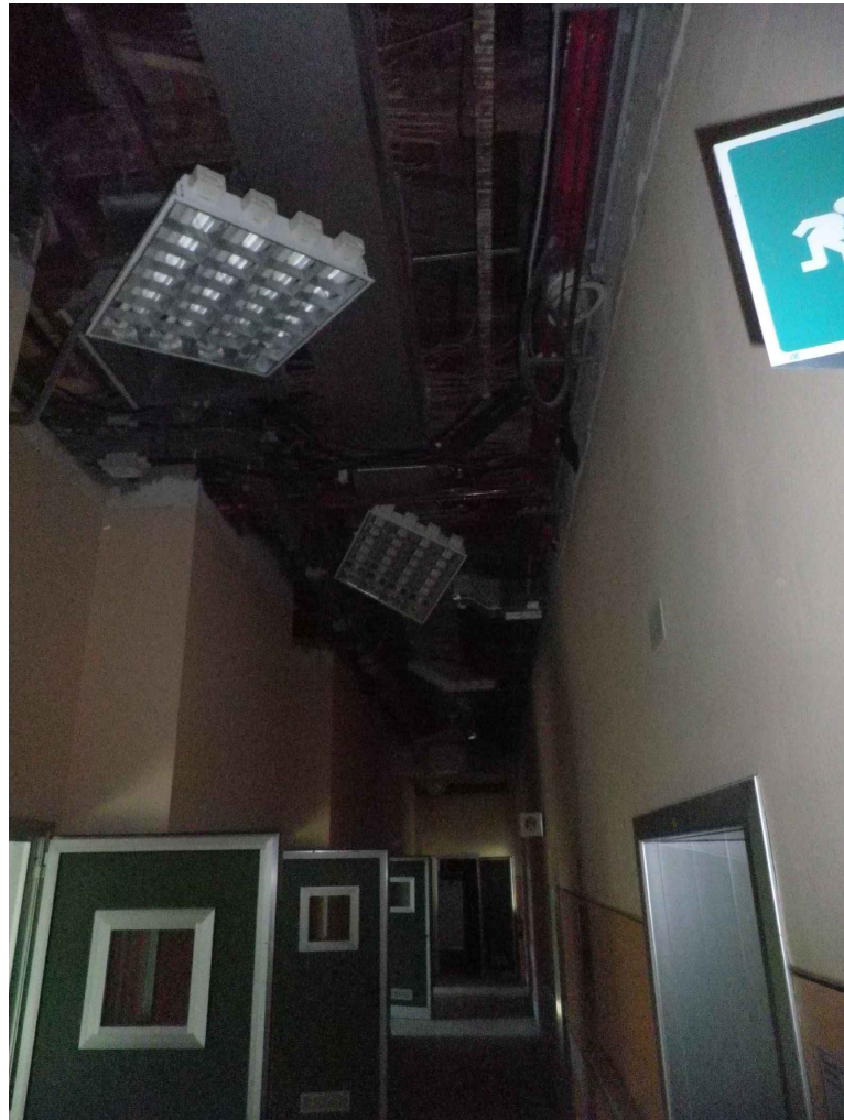
Vista dei condotti impiantistici