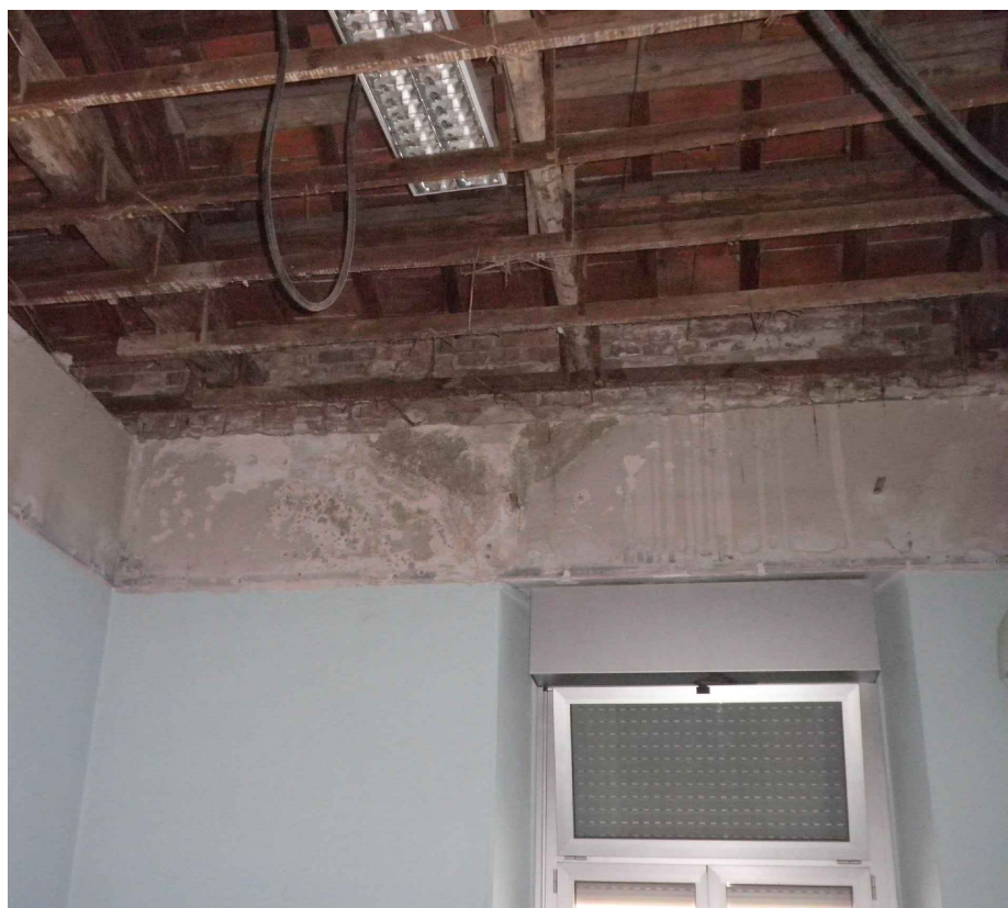
Vista del soffitto esistente