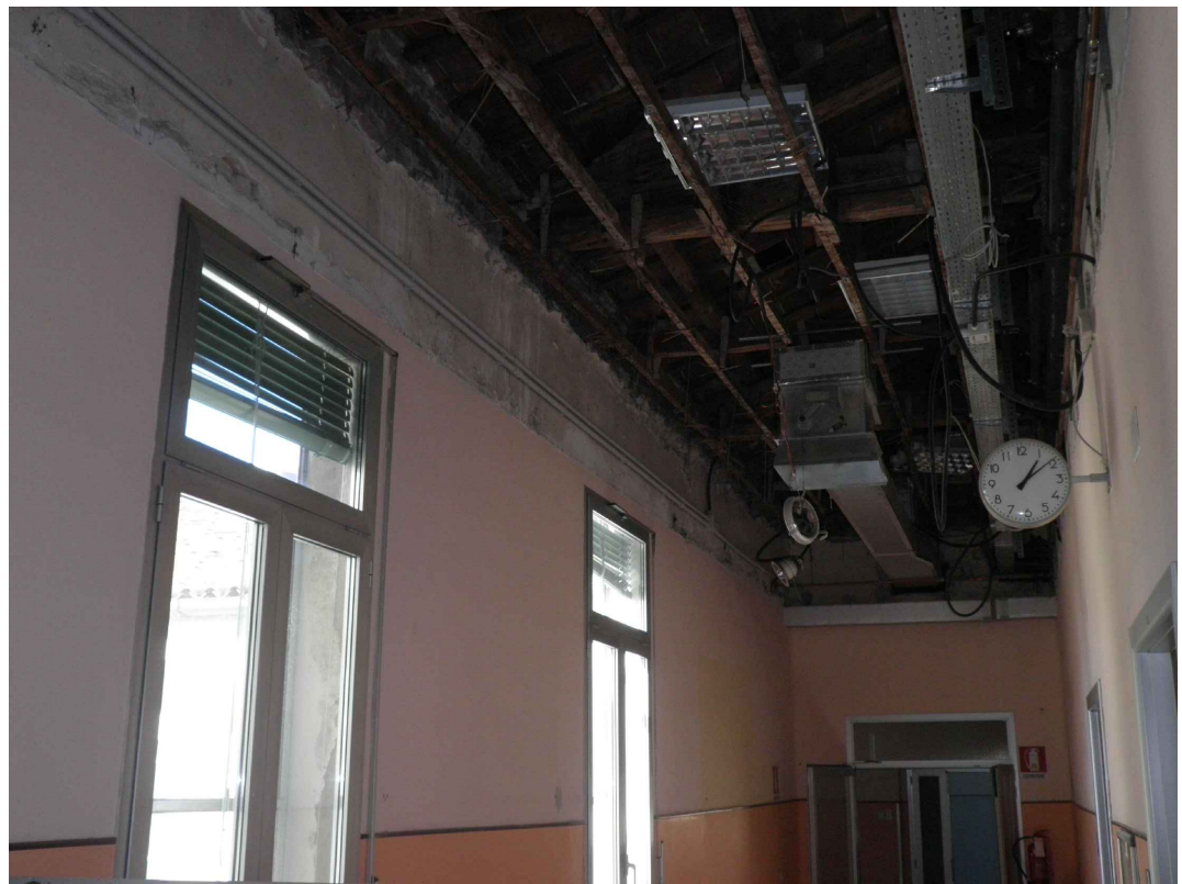
Vista delle strutture lignee