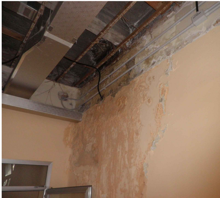
Vista dello stato dei luoghi